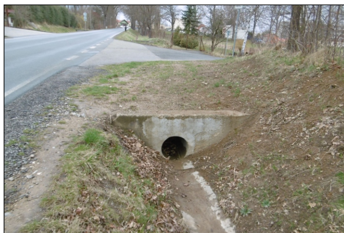
Propustek 3c - staničení 0,003 - pohled zprava