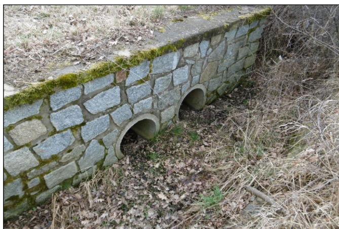
Přepad z rybníka 14c - staničení 1,348 - pohled zleva