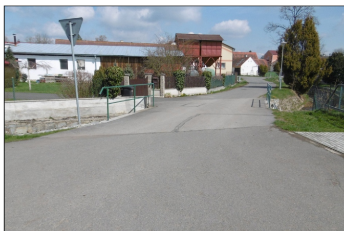
Most 15c-M1 - staničení 0,181 - celkový pohled