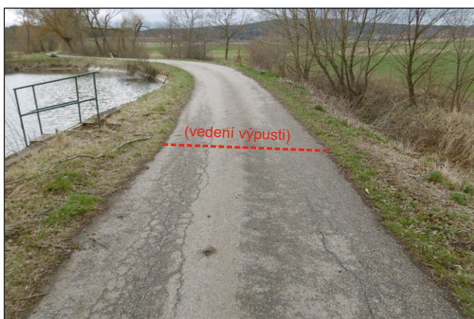
Výpust z rybníka 14c - staničení 1,382 - celkový pohled