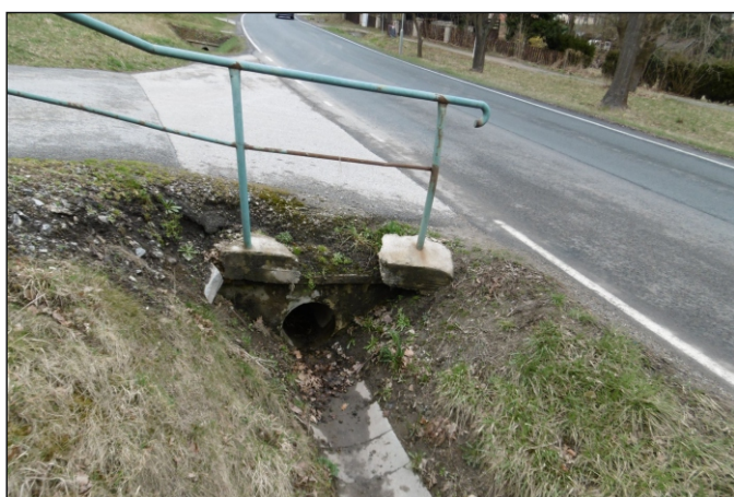
Propustek 8c - staničení 0,002 - pohled zleva