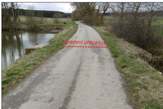
Přepad z rybníka 14c - staničení 1,348 - celkový pohled