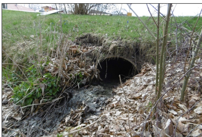
Propustek 2b - staničení 1,600 - pohled zleva