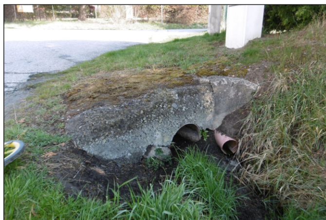
Propustek 25c - staničení 0,007 - pohled zprava