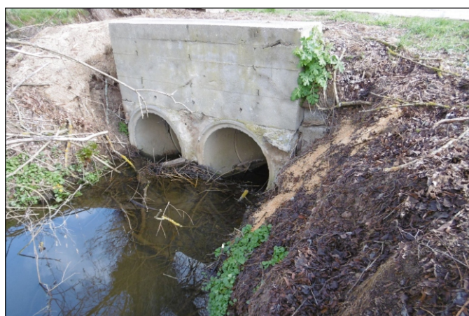
Propustek 26c - staničení 0,729 - pohled zleva