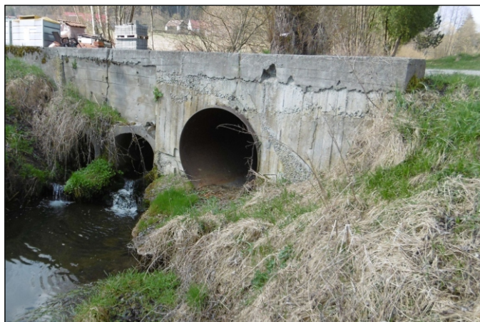
Propustek 1c - staničení 1,315 - pohled zleva