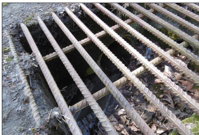
Propustek 18c - staničení 0,029 - pohled zleva