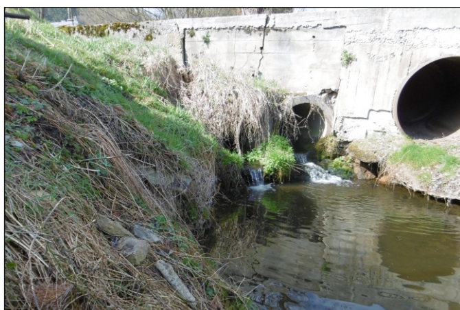
Propustek 26c - staničení 0,729 - pohled zprava