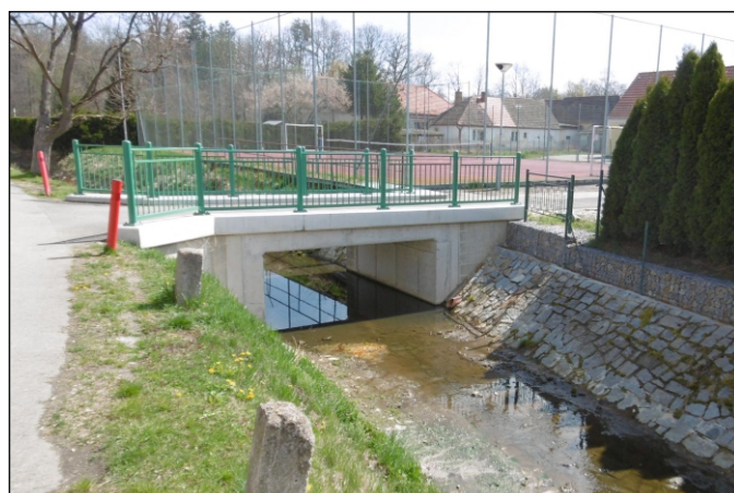
Most 16c-M1 - staničení 0,152 - pohled zleva