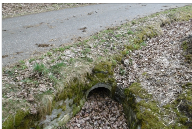
Propustek 14c - staničení 1,656 - pohled zleva