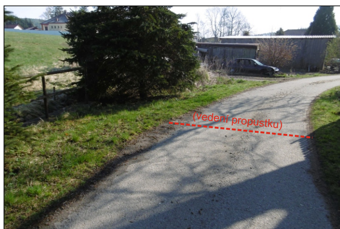
Propustek 2c - staničení 1,467 - pohled zleva