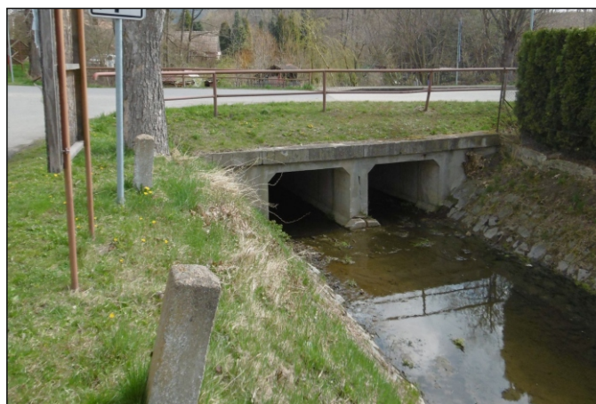
Propustek 2b - staničení 1,456 - pohled zprava