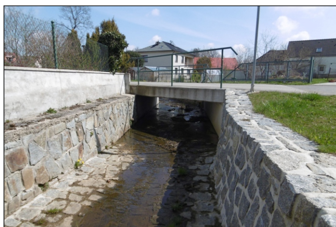
Most 15c-M1 - staničení 0,180 - pohled zprava