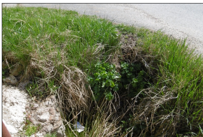
Propustek 20c - staničení 0,001 - pohled zleva