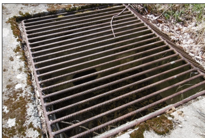
Propustek 18c - staničení 0,211 - pohled zleva