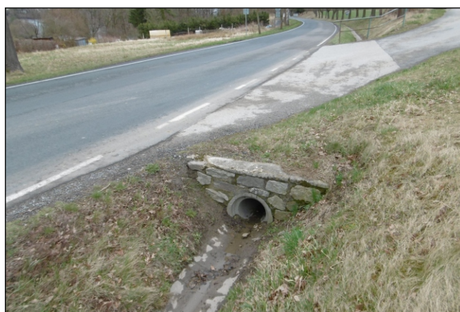
Propustek 8c - staničení 0,002 - pohled zprava