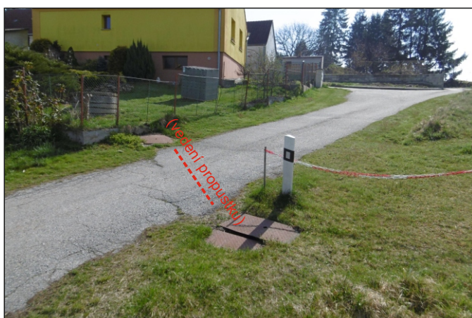
Propustek 26c - staničení 0,686 - pohled zleva