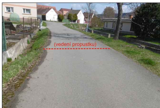
Propustek 15c - staničení 0,150 - celkový pohled