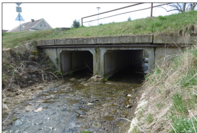
Propustek 2b - staničení 1,456 - pohled zleva