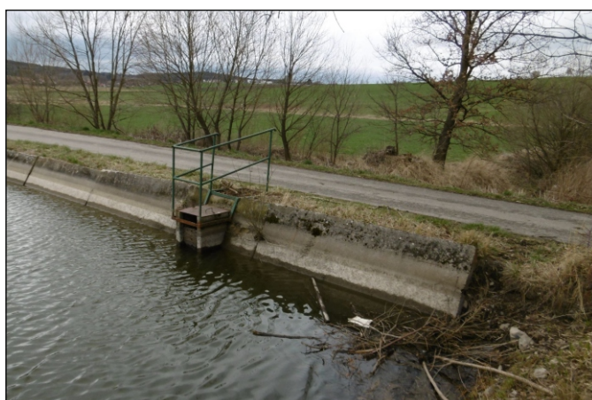
Výpust z rybníka 14c - staničení 1,382 - pohled zprava