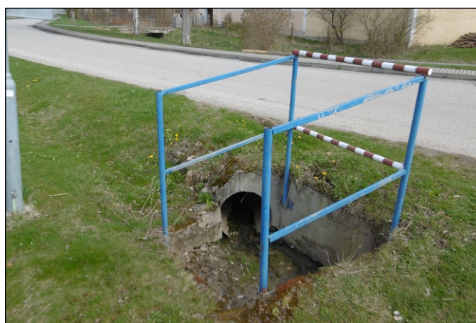
Propustek 2b - staničení 1,600 - pohled zprava