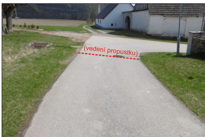
Propustek 18c - staničení 0,211 - celkový pohled