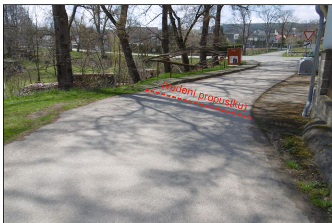
Propustek 18c - staničení 0,029 - celkový pohled