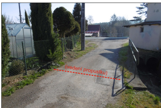
Propustek 2c - staničení 0,311 - pohled zprava