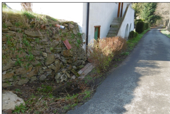
Propustek 1c - staničení 1,315 - pohled zprava