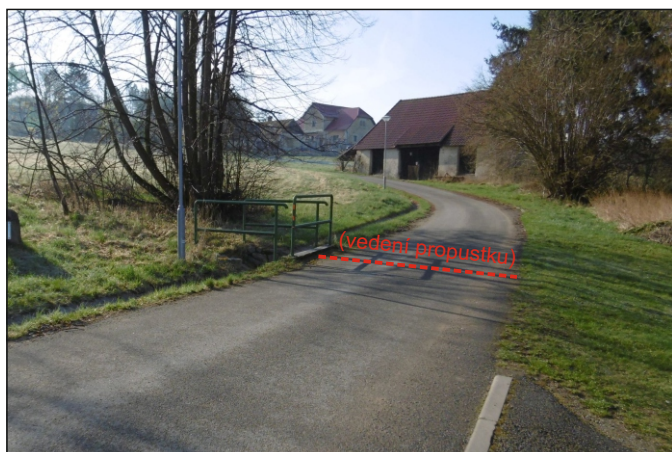
Propustek 1c - staničení 1,315 - pohled zleva