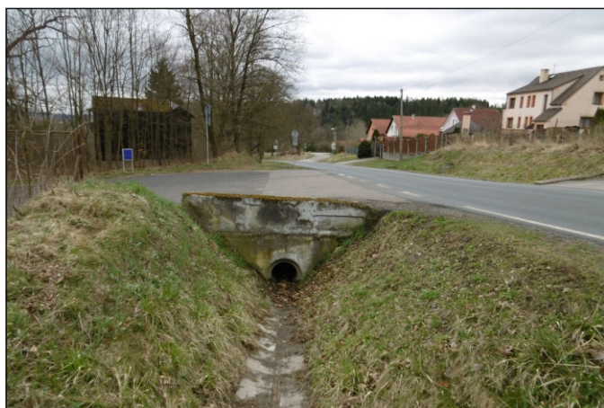
Propustek 3c - staničení 0,003 - pohled zleva