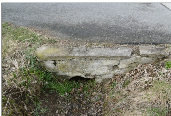
Propustek 13c - staničení 0,002 - pohled zleva