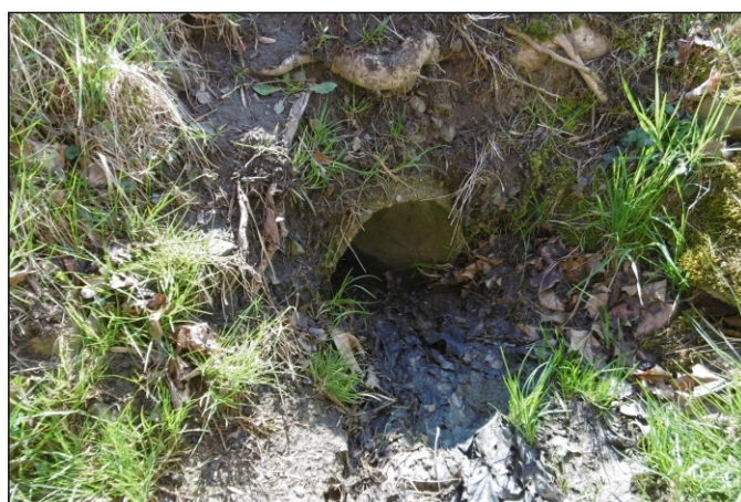
Propustek 15c - staničení 0,150 - pohled zprava